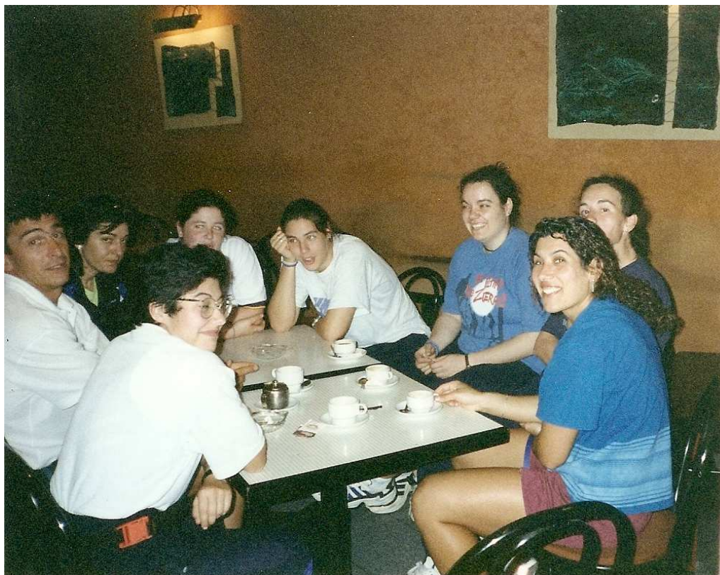
Reunión previa á competición. Segunda xornada, Madrid, 23/05/1998