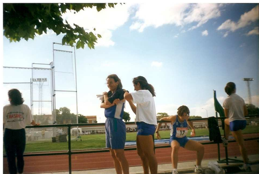
Colocación de dorsais. Tercera xornada, Valladolid, 13/06/1998