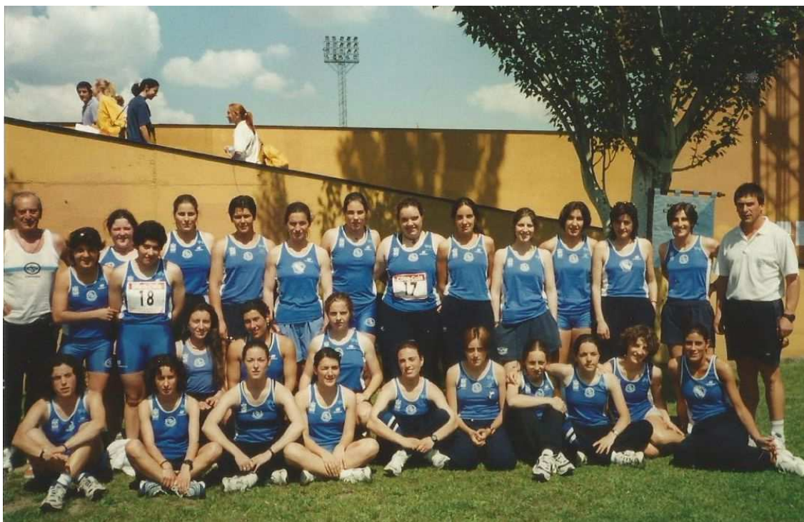
Equipo femenino. San Sebastián, 20/06/1998