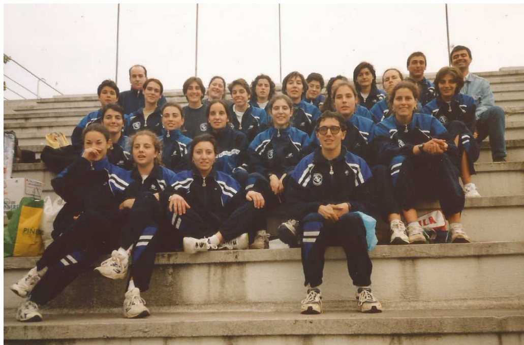
Equipo femenino. Vigo, 08/05/1998